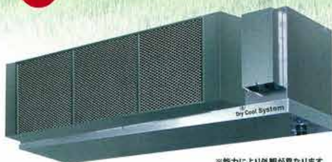
※能力により外観が異なります。